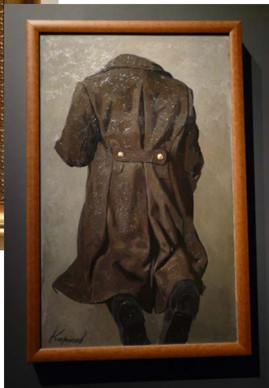
Г. Коржев. Шинель и сапоги. 1950-е

В 1963 году Юрий Любимов, актер Театра им. Евг. Вахтангова, поставил с выпускным курсом Щукинского училища спектакль «Добрый человек из Сезуана» по пьесе Бертольта Брехта, с которым связана история рождения Театра на Таганке. Вместе с Любимовым сюда пришли молодые Валерий Золотухин, Николай Губенко, Владимир Высоцкий, Борис Хмельницкий, Нина Шацкая и другие талантливые актеры.