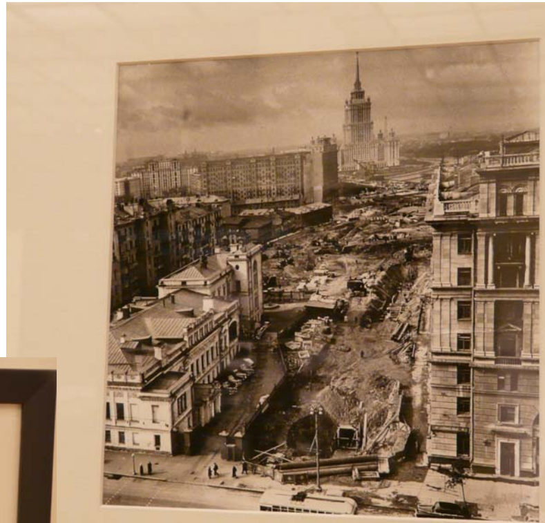
«Прорубают» проспект Калинина (ныне Новый Арбат). 1963