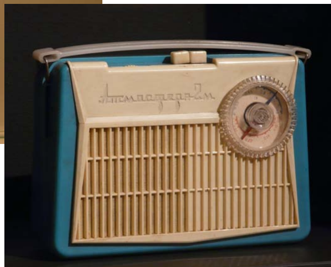
Радиоприемник переносной «Атмосфера-2М». 1962