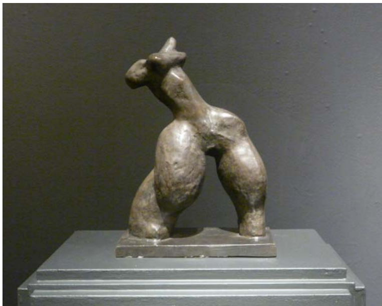
Э. Неизвестный. Шаг. 1960

В жизни большой страны и многих миллионов ее граждан был период массовых репрессий 1930-х годов, Великая Отечественная, ГУЛАГ... В искусстве к этим темам Художники в самом широком значе-