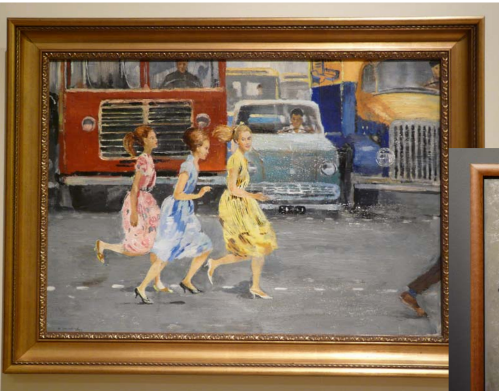
Ю. Пименов. Бегом через улицу. 1963