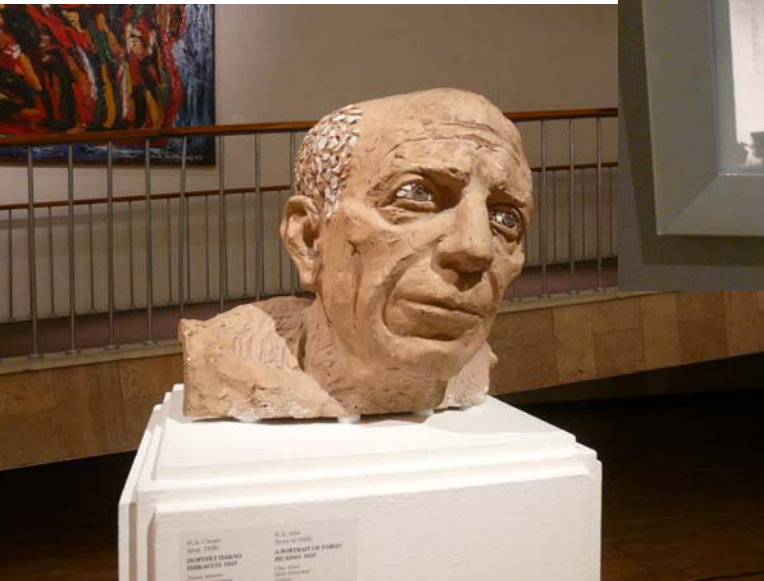
Н. Силис. Портрет Пабло Пикассо. 1957

«Добрый вечер» в исполнении Ларисы Мондрус, а художники воспевают город и изменяющуюся городскую среду в своих живописных полотнах.