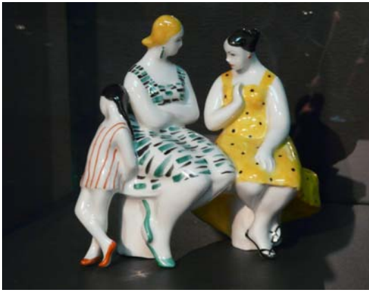
М. Пермяк. Сплетницы. 1960-е