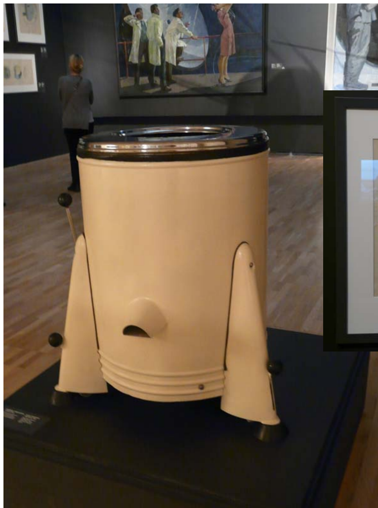
Машинка стиральная «ЭАЯ-3». 1954

свой павильон на Венецианской биеннале, где представил более 200 произведений живописи, графики и скульптуры, созданных в течение последних 20 лет.