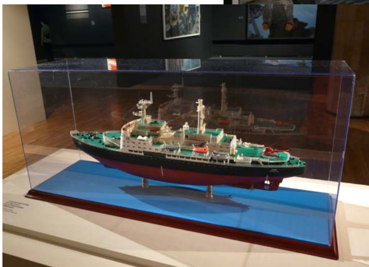
Макет атомного ледокола «Ленин»